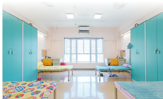
◆簡約開揚的房間為每位宿生創設獨特的個人自習空間。

曹校長稱：「日常的洗衣、熨衣，宿生都要親力親為；宿舍的大清潔日，宿生均要合力清潔房間，學習群居互助之道。宿舍導師大部分為註冊社工，有豐富的青年輔導經驗，愛心滿滿，積極為宿生安排多元化活動，如夜間觀星；又時刻細聽宿生的心事，適時作出輔導。這種陪伴成長的經歷，確實成為畢業生最佳的記憶。」宿舍導師與每位宿生每年均會制定「個人成長計劃」，一同規劃年度目標及施行方法，務求提升宿生的執行力及自省力。宿舍部每天均會與學校部進行溝通，彼此交流宿生日間在學校，夜間在宿舍的動態，讓整個教學團隊能更精準地照顧宿生的身心靈健康。