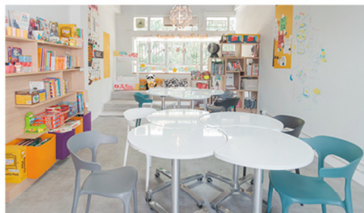
◆締造無限學習英語機會的 English WonderLand，學生流連忘返。