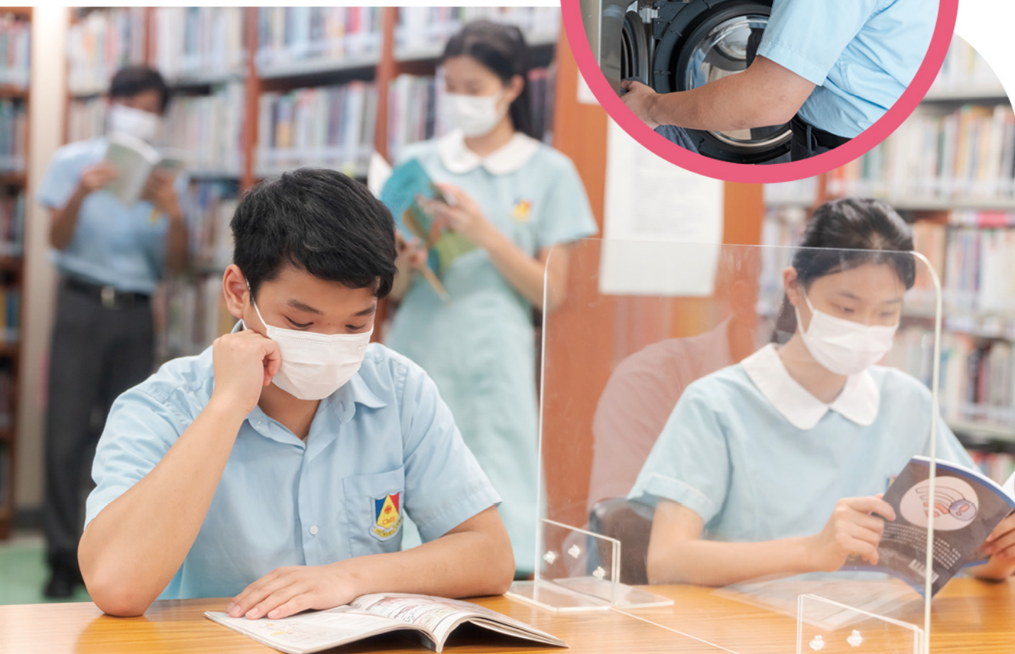
◆圖書館曾獲業界大獎，常獲傳媒報道，每年與宿舍合辦大型閱讀推廣計劃，鼓勵閱讀與思考。